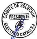
IMAGEN DE FUENTE REMYPE:

Es necesario precisar, luego de la verificación completa e integral (92 folios) de la oferta electrónica del postor AMERICA PRODUCTOS Y SERVICIOS SOCIEDAD COMERCIAL DE RESPONSABILIDAD LIMITADA , se puede evidenciar que el postor presenta el Anexo N.º 10 , establecido en la página 133 de las bases integradas, por lo tanto, el postor accede a la asignación de la Bonificación del cinco por ciento (5%) por tener la condición de Micro y Pequeña Empresa.