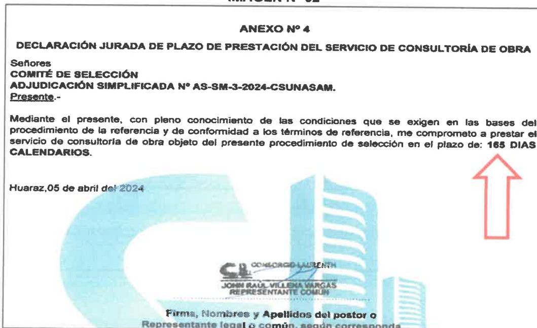
IMAGEN N° 02

Sin embargo, el postor CONSORCIO LAURENTH , consignó el plazo total de Ciento sesenta y cinco (165) días calendario y no el desagregado, tal como se detalla a continuación: