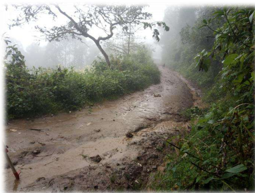
FOTO N° 1.- Se observa la carpeta de rodadura en estado de deterioro, con presencia de lodos y baches producto de cangrejas y ahuellamiento; calzada en terreno natural.

La situación negativa actual del ámbito de intervención se refiere y expone la condición y estado de la realidad, que ha permitido establecer que el problema central radica en el Bajo Nivel de Transitabilidad en el Camino de los caseríos ALTAMISA - PORTACHUELO.