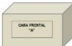
CARA FRONTAL "A"