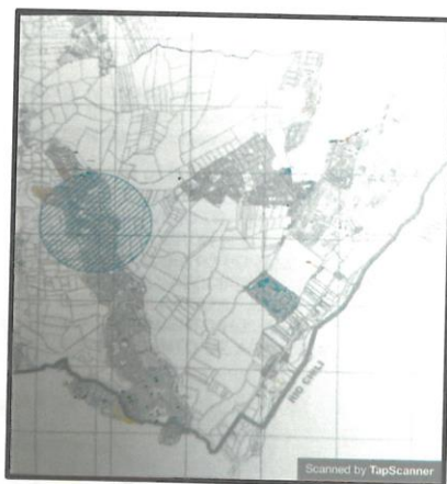
IMAGEN N° 01

SERVICIO DE CONSULTORIA, PARA LA ELABORACIÓN DEL EXPEDIENTE TÉCNICO DEL PROYECTO "MEJORAMIENTO DEL SERVICIO DE TRANSITABILIDAD PEATONAL Y VEHICULAR DE LA CALLE SIMÓN BOLÍVAR, JIRÓN N° 4, JIRÓN N° 5, CALLE N° 1, PASAJE 23, JIRÓN BELLAVISTA, AVENIDA TÚPAC AMARU, DEL ASENTAMIENTO HUMANO VÍCTOR MALDONADO, ASOCIACIÓN DE VIVIENDA JOSÉ MARÍA ARGUEDAS, ASOCIACIÓN DE VIVIENDA CORAZÓN DE JESÚS, ASENTAMIENTO HUMANO PEDRO VILCAPAZA, ASENTAMIENTO HUMANO SAN GERÓNIMO, PUEBLO JOVEN 07 DE JUNIO, ASENTAMIENTO HUMANO 1° DE JULIO DISTRITO DE SACHACA - PROVINCIA DE AREQUIPA - DEPARTAMENTO DE AREQUIPA", CÓDIGO ÚNICO DE INVERSIONES 2471246.