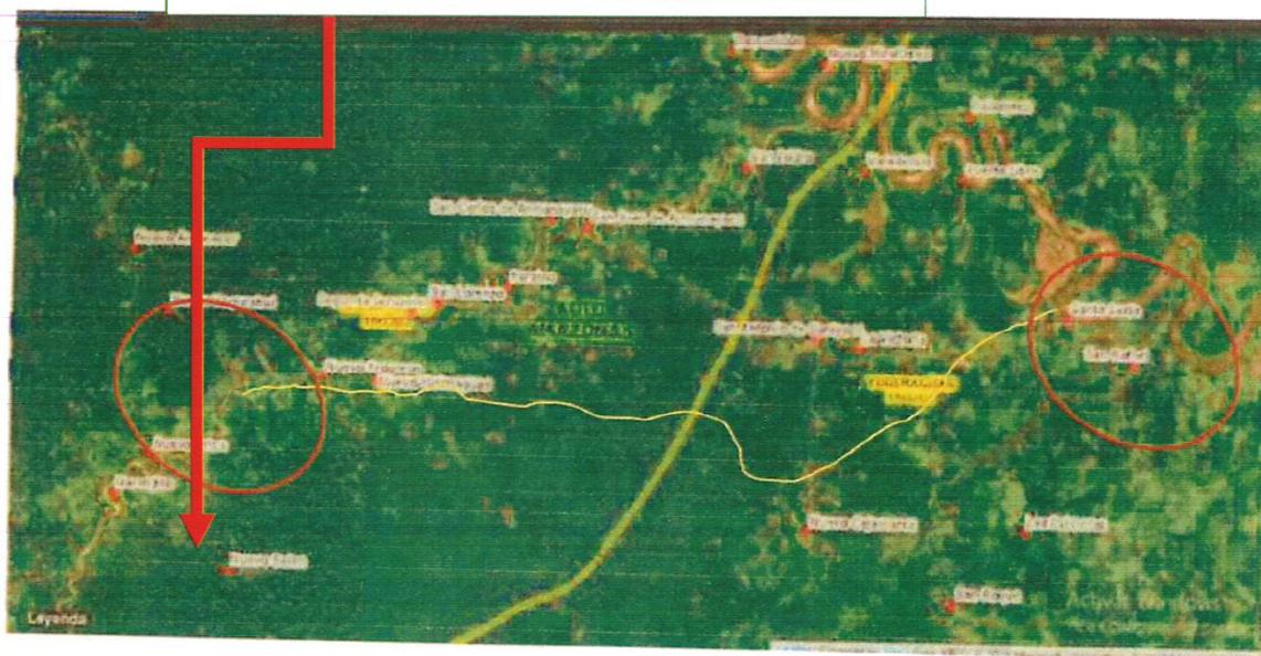
UBICACIÓN GEOPOLITICA UBICACIÓN DE ZONA A INTERVENIR

PROYECTO: "MEJORAMIENTO DEL SERVICIO DE TRANSITABILIDAD VIAL INTER URBANA DESDE RUTA LO – N°541 TRAMO: SAN RAFAEL – NUEVO ARICA, DISTRITO DE YURIMAGUAS Y BALSAPUERTO, PROINCIA DE ALTO AMAZONAS, DEPARTAMENTO DE LORETO".