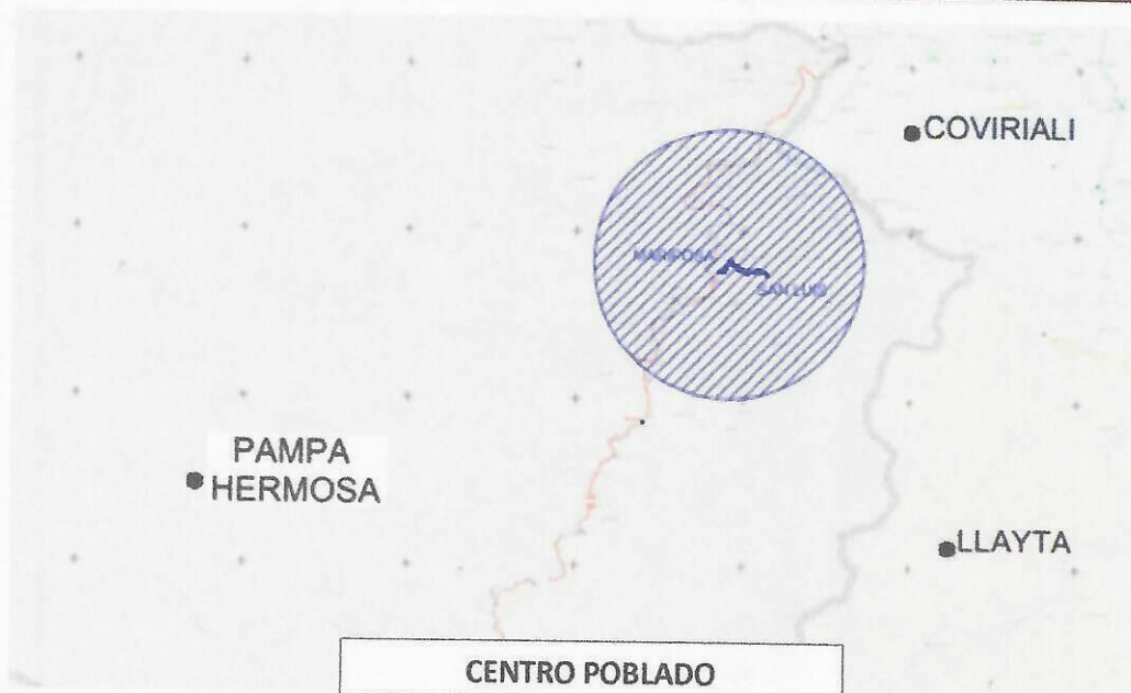
Ubicación Específica del tramo a intervenir