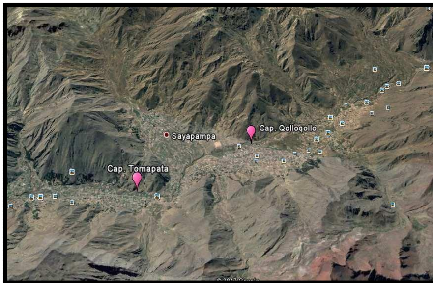
Figura 3. Punto de Captaciones Tomapata y Qolloqollo