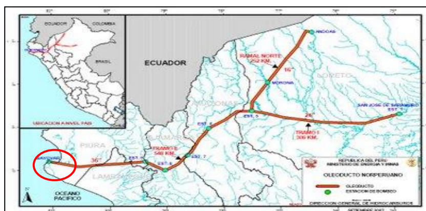
Figura N°1. Localización del servicio.