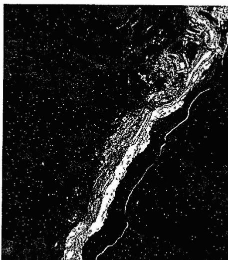
IMAGEN N° 02: IMAGEN SATELITAL DEL AREA DE INFLUENCIA

MUNICIPALIDAD DISTRITAL DE SANTA TERESA Ing. H. Díaz Cáceres Econ. E.I. N° 1305 JEFE (H) DE LA OF. FORMULADORA Y EVALUADORA DE INV. JEFE (H) DE OFICINA DE ESTUDIOS DEFINITIVOS