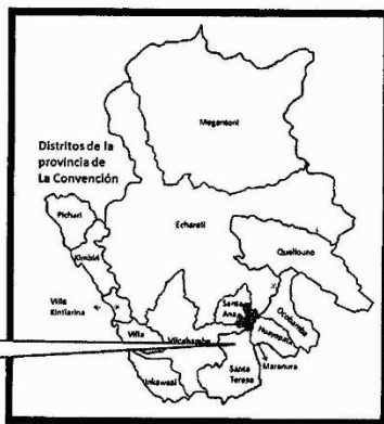
IMAGEN N° 01: LOCALIZACIÓN GEOGRÁFICA PROVINCIA: LA CONVENCION