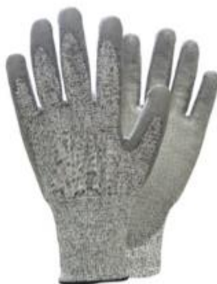
GUANTES DE TRABAJO