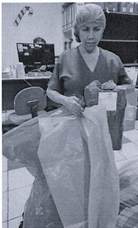
IMAGEN DE LA MUESTRA ALCANZADA POR EL POSTOR: C&A MEDI PLAST DEL PERU E.I.R.L