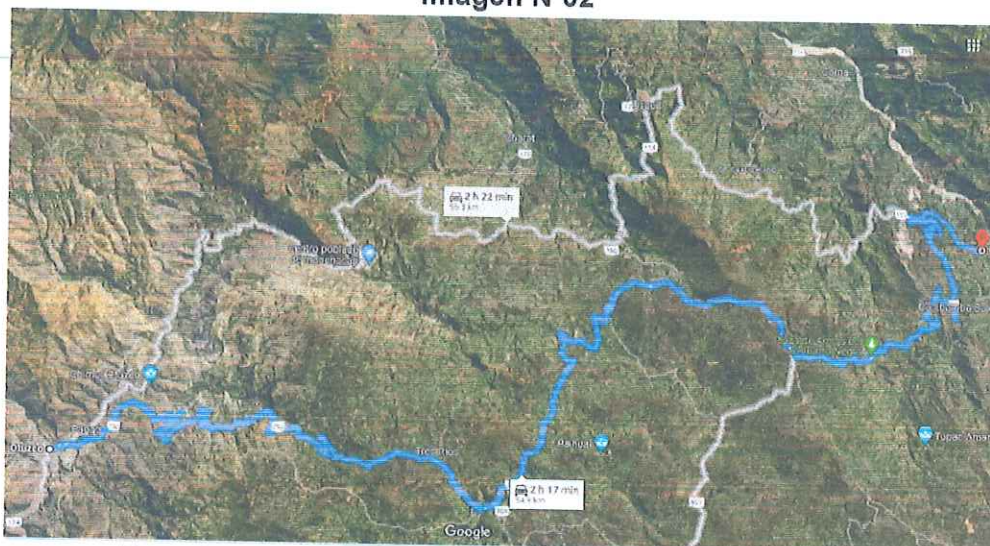
Descripción: Ruta de Otuzco- Centro Poblado San Martín