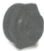
Conexión hexagonal 2"