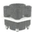
Conexión para drenaje 2"