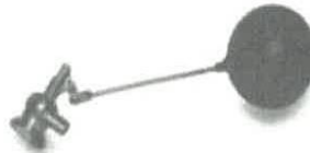
Válvula flotadora de control