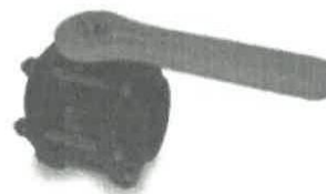
Válvulas full port 2"