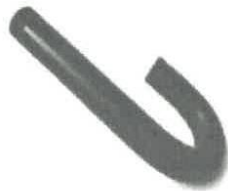
Tubo de aireación 2"