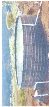
Figura: Corte transversal de geotankue

El geotankue consta de soporte de malla y postes metálicos como paredes, una manita de geomembrana de 1.5 mm lipo bolsa, fijados con grapas metálicas y cintillos de nylon, la corona del geotankue es asegurado con manguera de jardín de 1/2" y manguera de hdpe de 32mm.