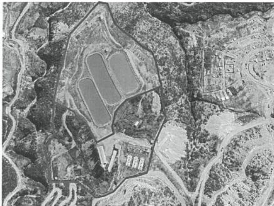
Predio materia de Compra-Venta, A=41,498.847 m 2 Vista Satelital

GOBIERNO REGIONAL DE AYACUCHO NETA 130 - IMPLEMENTACIÓN DEL SISTEMA DE AGUA POTABLE SISTEMA DE ALCANTARILLADO Y TRATAMIENTO DE AGUAS RESIDUALES DE LAS LOCALIDADES DE HUAYLLABITA, MOLLEPATA Y AÑENCO