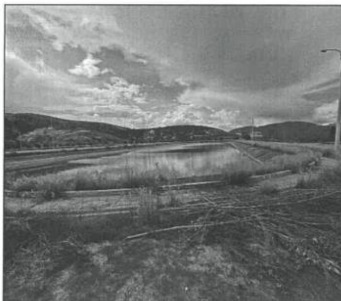
Área de la compra y venta, Vista de Lagunas de Maduración