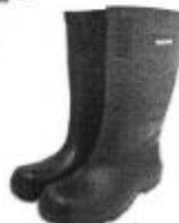
Bota de Jebe

Equipos de Protección Personal (EPPs) los cuales deberán ser reemplazados de acuerdo a la necesidad. En el caso de los cascos de protección estos deben cumplir con los requisitos de absorción de impacto y resistencia a la penetración el personal de mantenimiento deberá usar cascos de color anaranjado, mientras que de los jefes de mantenimiento deberá ser color azul.