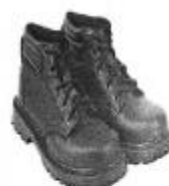
Zapato de seguridad Puntera Acero