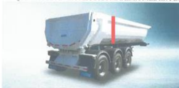
*COLOR ROJO ALTURA TOTAL DE LA TOLVA