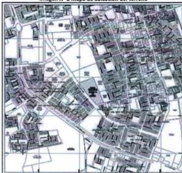
Imagen N° 2 Mapa de ubicación del terreno