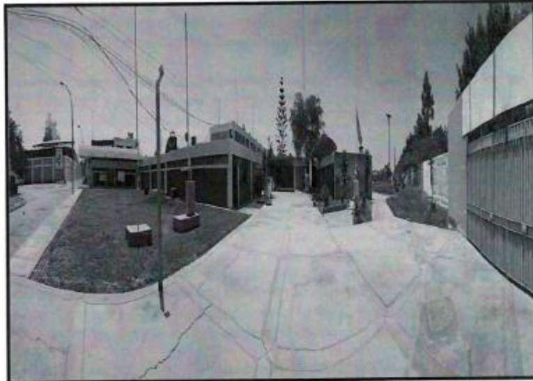
Vista fotográfica actual del Instituto de Educación Superior Tecnológico Público Catalina Buendía de Pecho