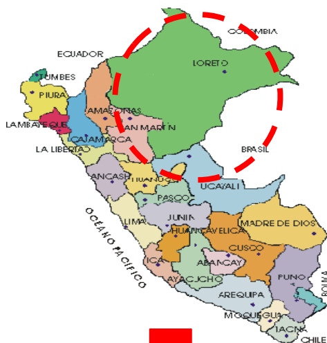
Regiones del Perú