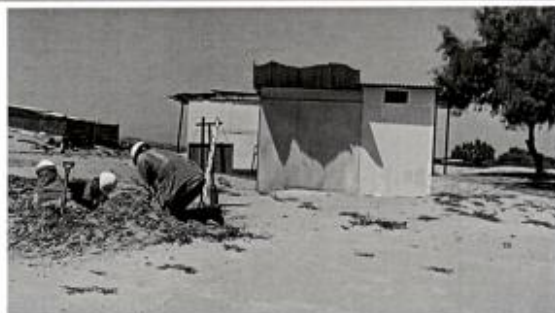
Fotografía N° 03 Vista exterior del SSHH

"MEJORAMIENTO Y AMPLIACIÓN DEL SERVICIO DEL NIVEL EDUCATIVO DE LA I.E. DEL NIVEL INICIAL N°1563 DEL CENTRO POBLADO EL TABANCO DEL DISTRITO DE EL TALLAN – PROVINCIA DE PIURA – DEPARTAMENTO DE PIURA – CON CUI N°2476117"