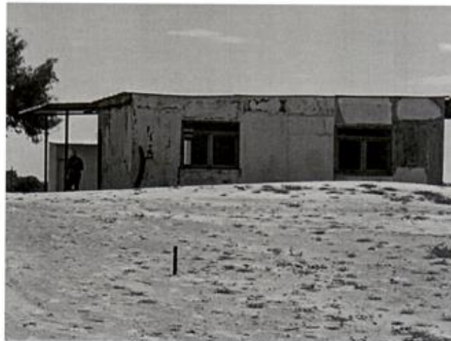
Fotografía N° 02 Vista exterior Aula de cuatro y 05 años

Los muros se encuentran en mal estado como se aprecia en la imagen.