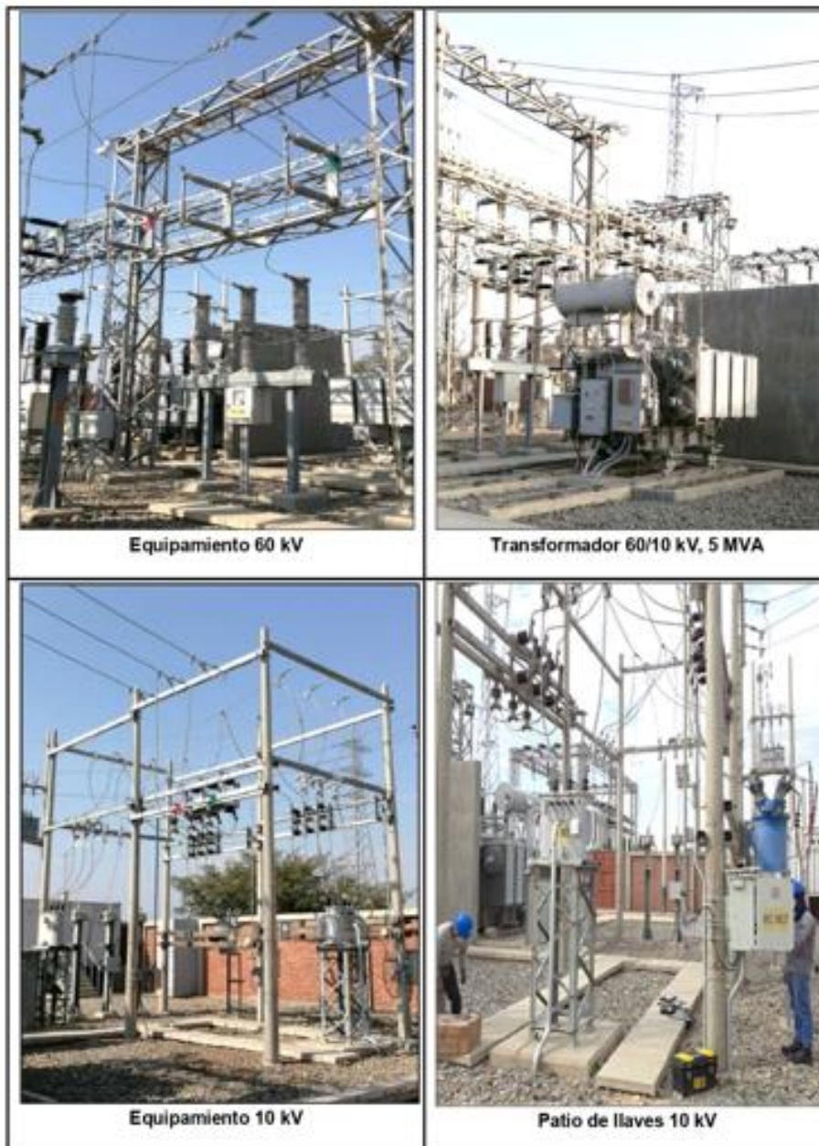
ANEXO N° 06 EQUIPAMIENTO EN SUBESTACIÓN OCCIDENTE