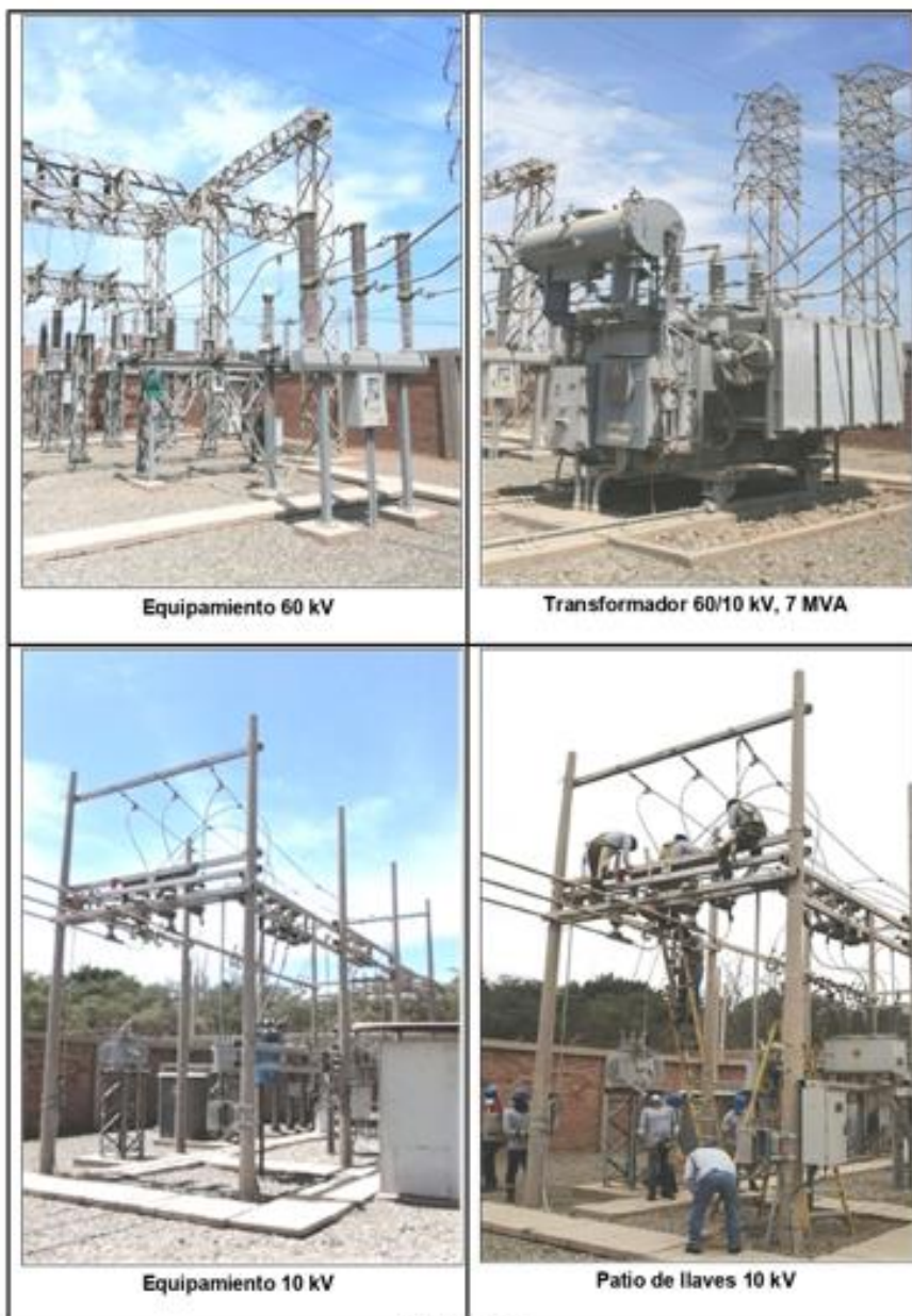
ANEXO N° 04 EQUIPAMIENTO DE SUBESTACIÓN ILLIMO