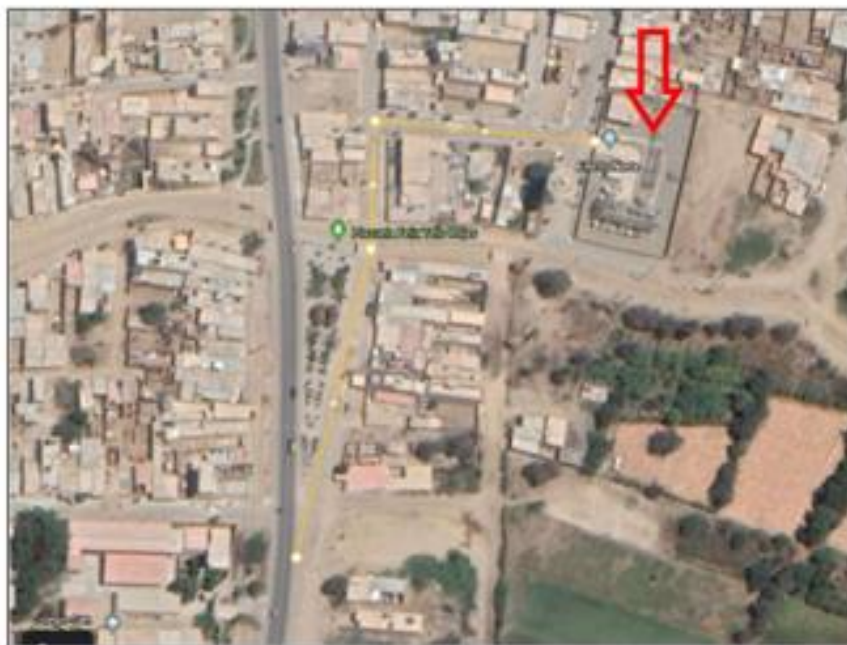
SUBESTACIÓN ELÉCTRICA ILLIMO