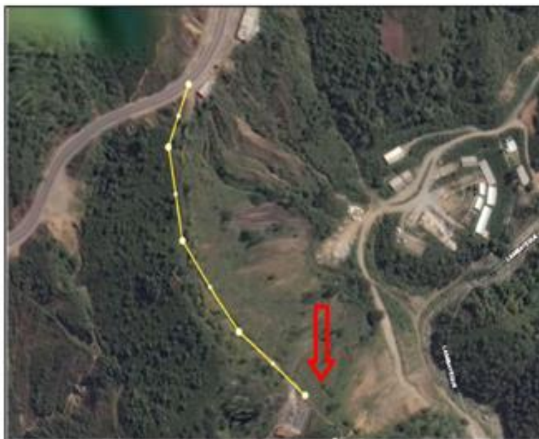
SUBESTACIÓN ELÉCTRICA OCCIDENTE