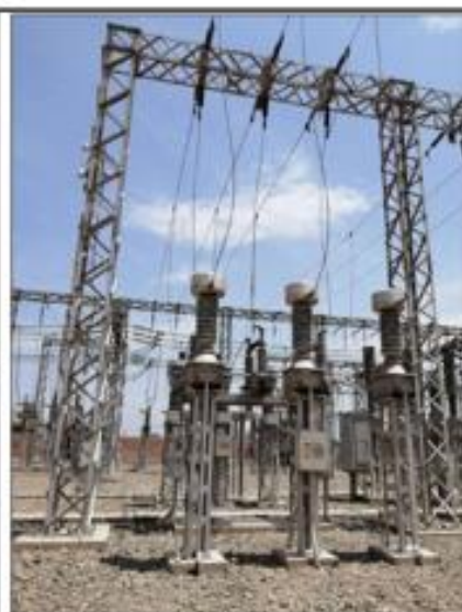
Equipamiento celda 60 kV L-6033