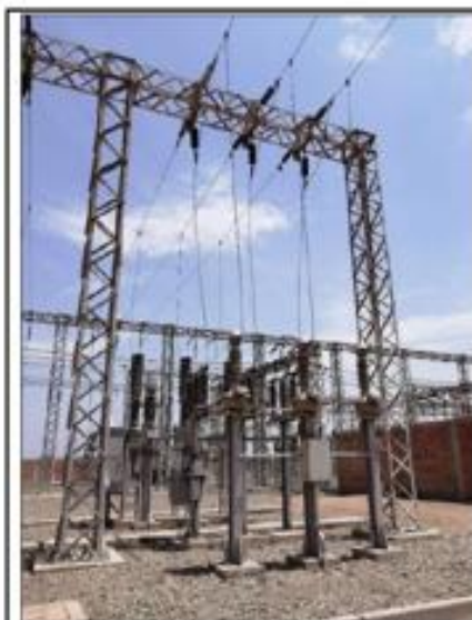
Equipamiento celda 60 kV L-6032