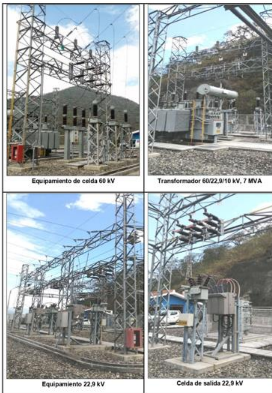
ANEXO N° 07 LINEA DE TRANSMISIÓN 60 KV CHICLAYO – ILLIMO