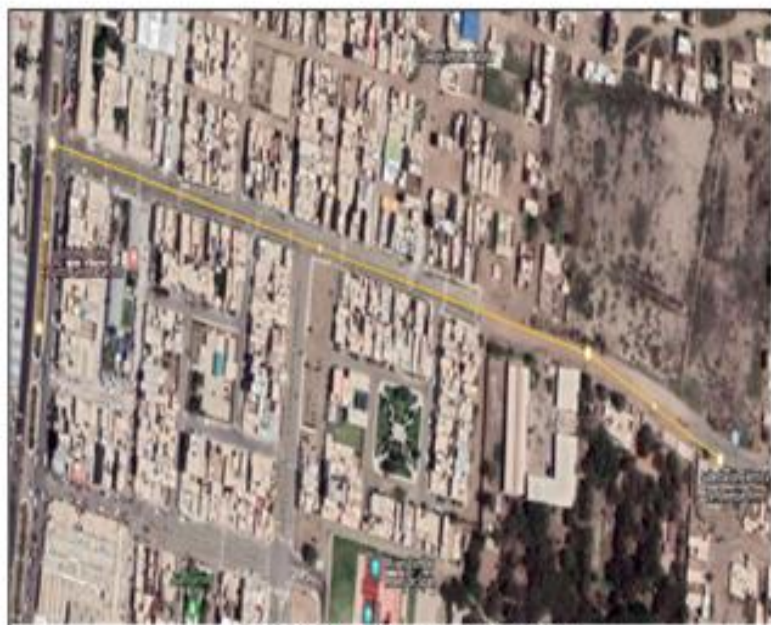
SUBESTACIÓN ELÉCTRICA LAMBAYEQUE