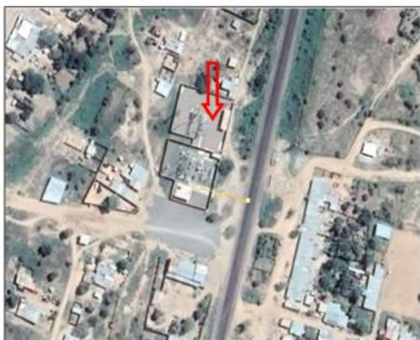
SUBESTACIÓN ELÉCTRICA LA VIÑA