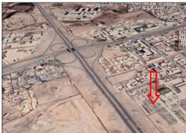
CELDA DE SALIDA 60 KV SUBESTACIÓN CHICLAYO OESTE