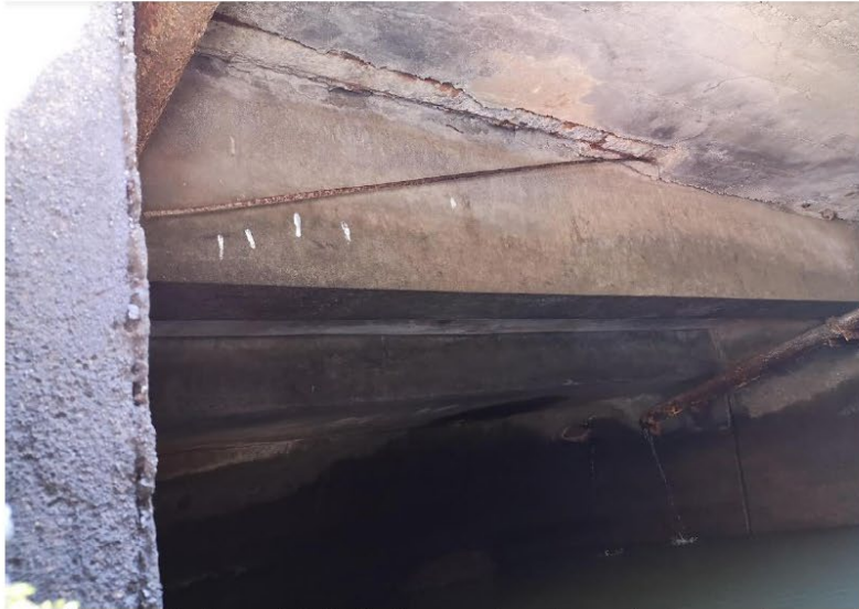
Imagen 03: Pérdida de recubrimiento de concreto en losas de piso, con la exposición del acero de refuerzo.

Generando Energía con Responsabilidad Social