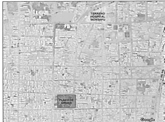
Imagen 01: Ubicación del Establecimiento de Salud Monsefú.

Departamento : Lambayeque Provincia : Chiclayo Distrito : Monsefu