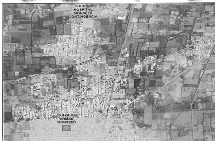
Imagen 02: Ubicación del Plan de Contingencia.