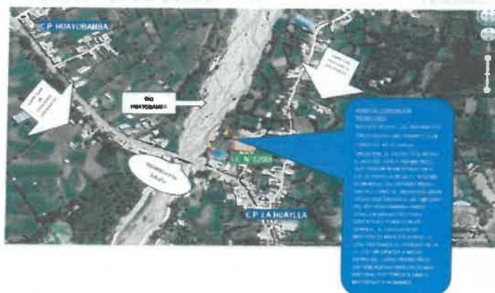
Figura 2: Macro localización Distrito de Pedro Gálvez