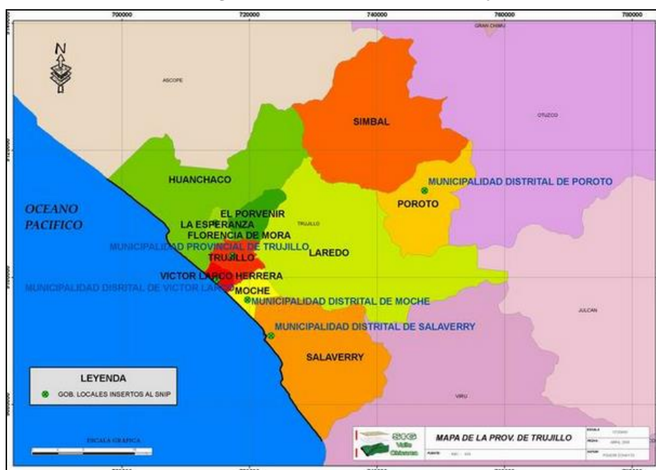
Imagen N° 01: Provincia de Trujillo