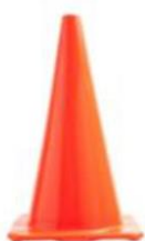
CONO DE SEGURIDAD