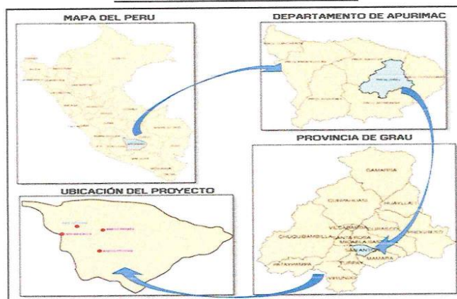
MAPA N° 01: UBICACIÓN DEL PROYECTO