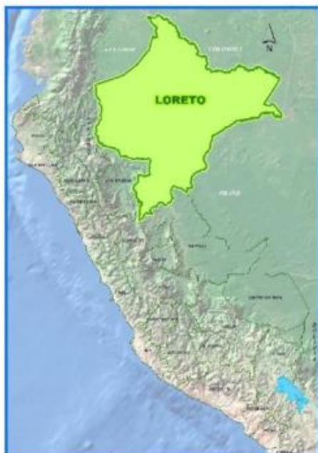
Gráfico 1: Ubicación del departamento de Loreto