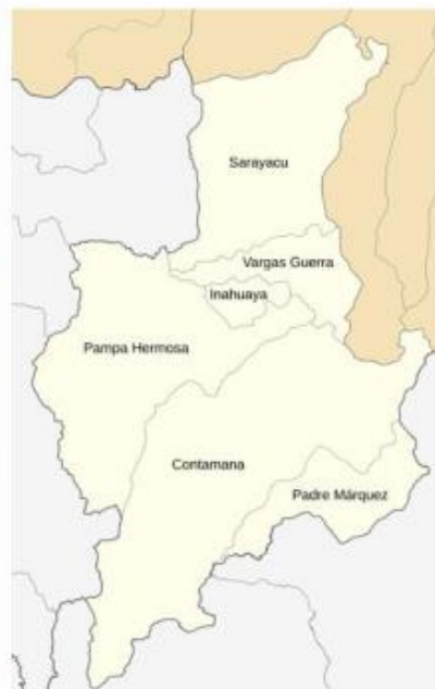
Gráfico 2: Ubicación de la provincia de Ucayali