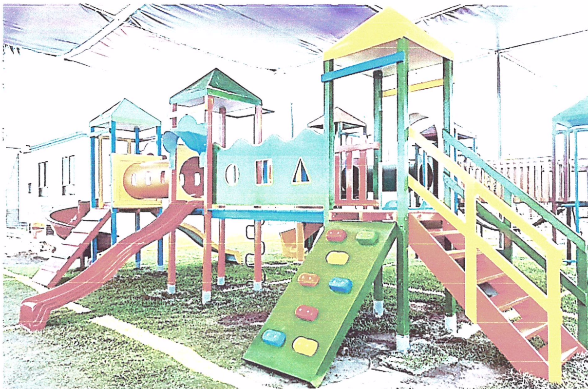
Imagen 2: Imagen referencial de la adquisición de juego recreativo

"CREACION DEL SERVICIO DE PRACTICA DEPORTIVA Y/O RECREATIVA EN LA AV OSCAR R BENAVIDES DEL CP TAMBO DE MORA DISTRITO DE TAMBO DE MORA DE LA PROVINCIA DE CHINCHA DEL DEPARTAMENTO DE ICA" CUI 2647373