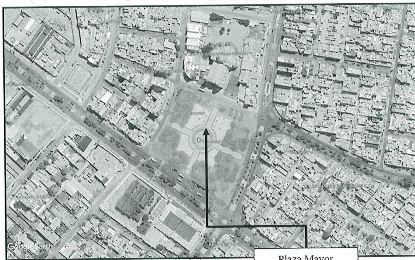
Imagen 01. Ubicación del proyecto.

DEPARTAMENTO : Ancash PROVINCIA : Santa DISTRITO : Nuevo Chimbote LOCALIDAD : Casco Urbano Nuevo Chimbote