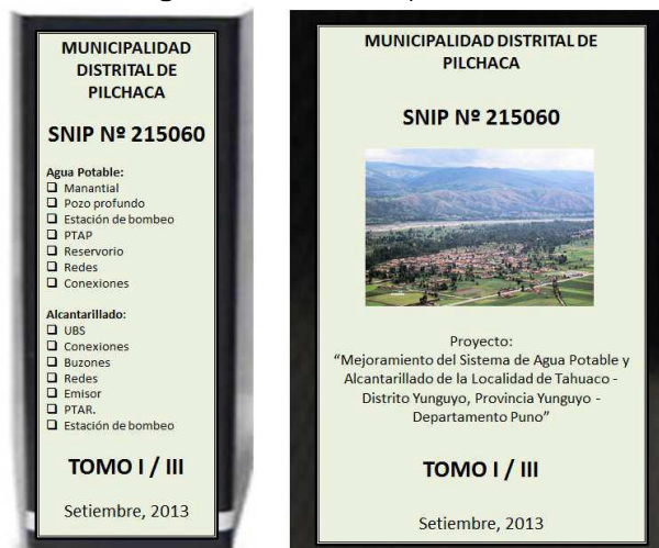
Figura 1. Forma de presentación del Expediente

Los expedientes deberán ser presentados en archivadores de palanca de lomo ancho. Cada archivador deberá considerar una carátula en la parte frontal y en lomo del mismo, para una rápida verificación. Se recomienda que dichas carátulas, deberán indicar como mínimo, lo indicado en la figura 1.