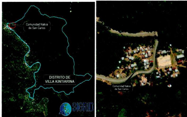
Fig.03: Planteamiento identificado San Carlos

Servicio de agua potable proyectado (el proyectista puede mejorar el planteamiento preliminar, según los estudios básicos elaborados)