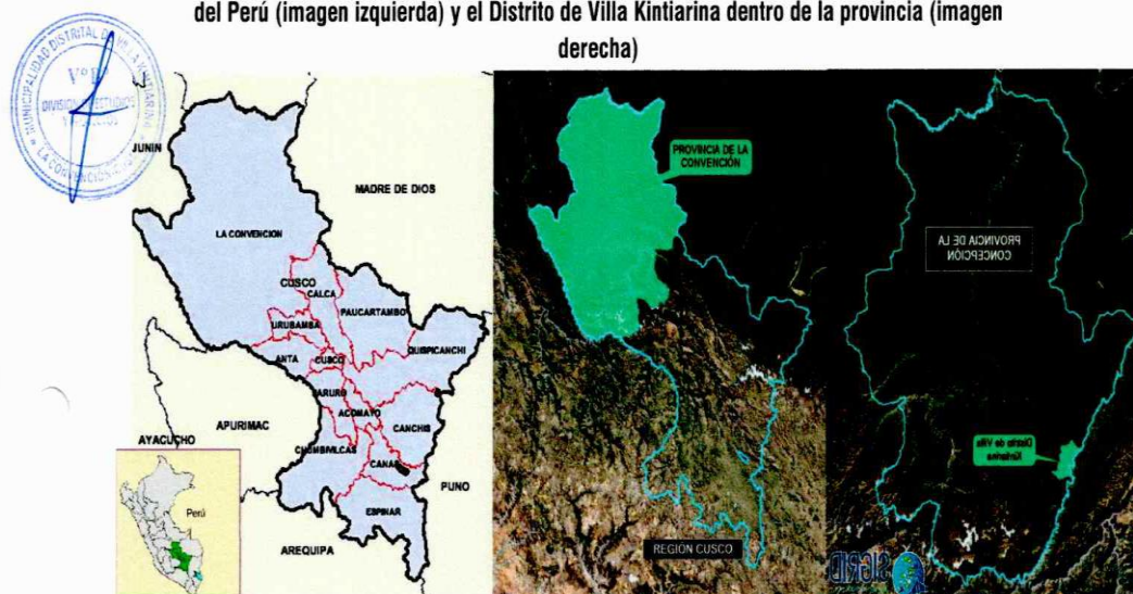
Fig. 01: Ubicación de la Provincia de La Convención, dentro de la región de Cusco- departamento del Perú (imagen izquierda) y el Distrito de Villa Kintiarina dentro de la provincia (imagen derecha)