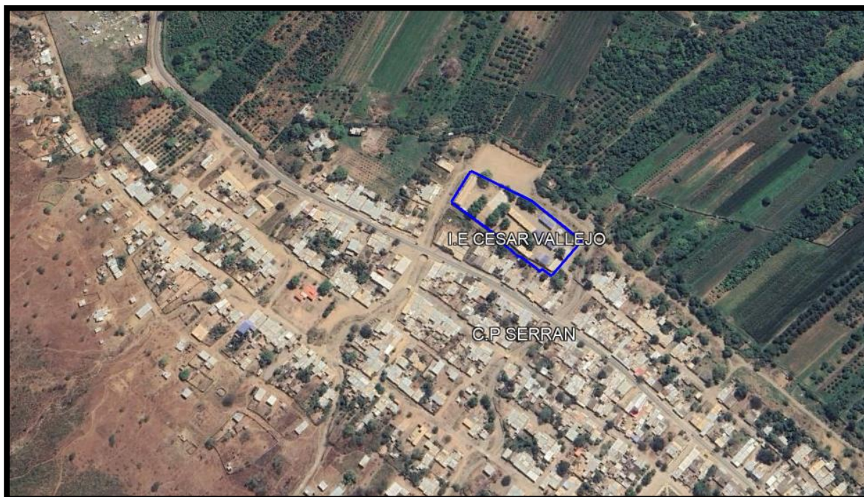
Ubicación de la I.E Cesar Vallejo