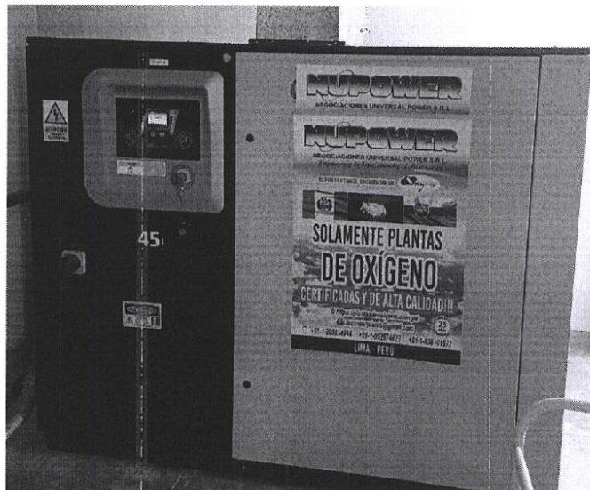
Secador de Aire / Marca: Risheng / Modelo: RSLF-100-PD