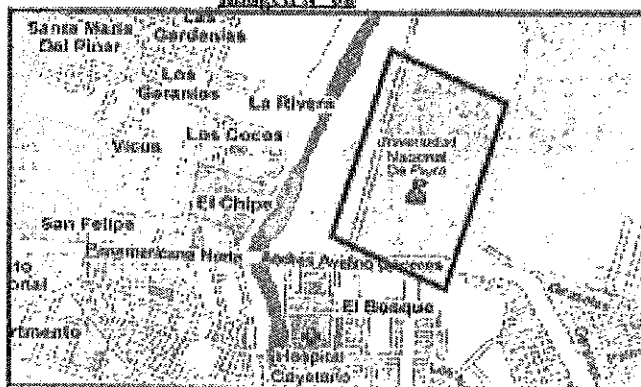
Imagen N° 02

La Universidad Nacional de Piura está ubicada en la Urb. Miraflores s/n, Castilla, Piura 295.