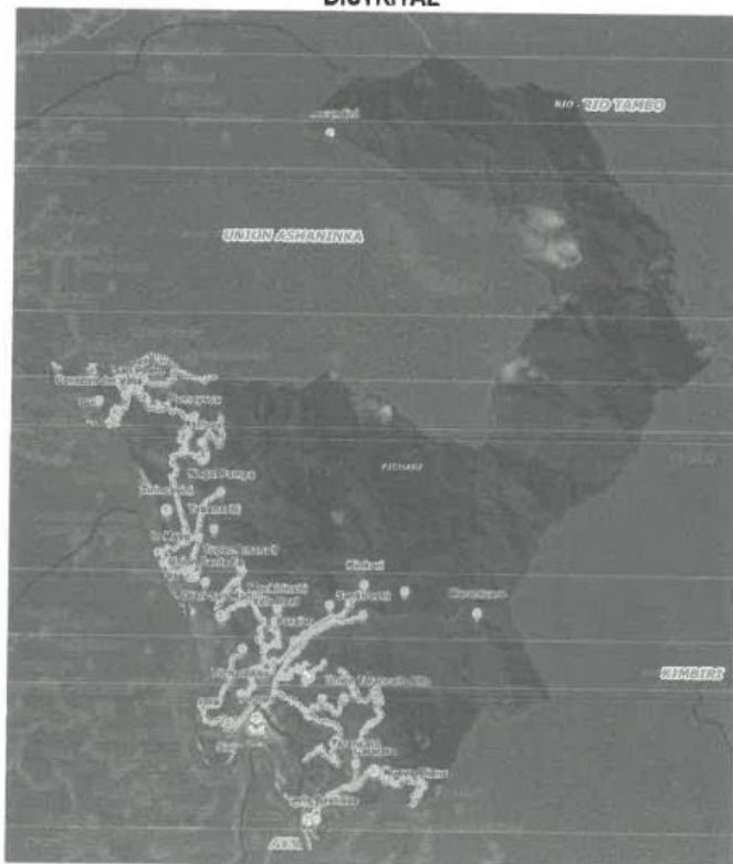
GRAFICO N°12: MICRO LOCALIZACIÓN DEL PROYECTO – NIVEL DISTRITAL