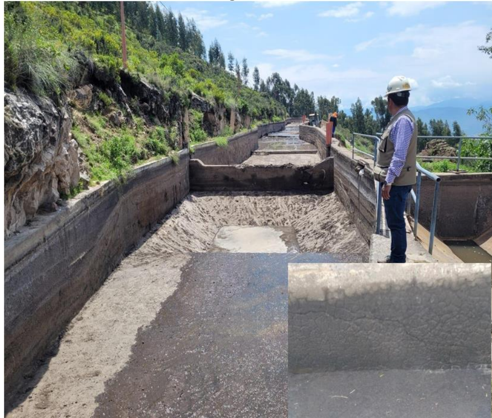
Imagen N° 02

Realizar la refacción e impermeabilización de la pared, la refacción de partes dañados, sellado de porosidades en la pared contención y piso de las 05 divisiones de nave, cámara de carga, más el embudo, el resane debe ser con material adherente a concreto, con alta resistencia a agua y mucha duración, en la Imagen N°02 se muestra la cámara de carga y las grietas existentes a lo largo de la cámara de carga.