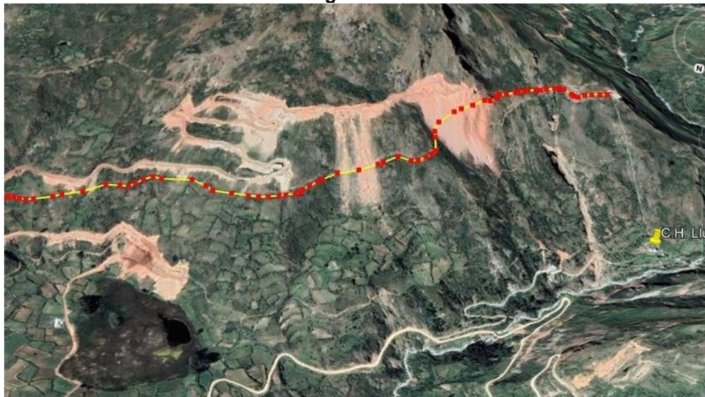
Imagen N° 03

Concluido la limpieza del canal, previa inspección conjunta con el área usuaria determinara los donde realizara la reconstrucción del canal colapsado, demolición de canal afectado y nuevo cimentado de la pared y piso con concreto armado y amarres de acero, llegando a cubrir el total de metrado previsto.