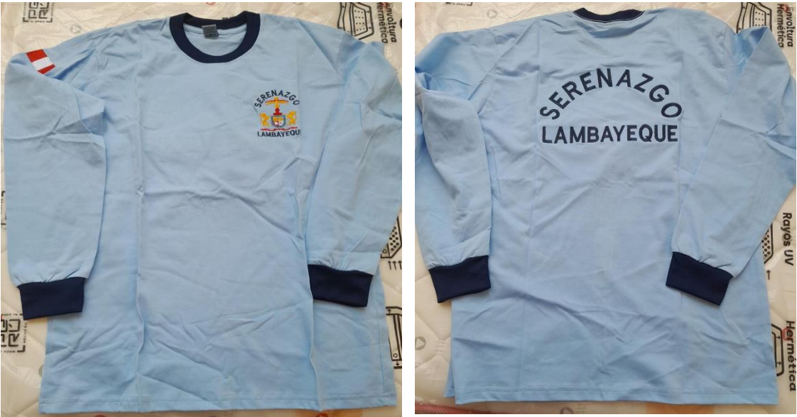
IMAGEN REFERENCIAL POLO MANGA LARGA