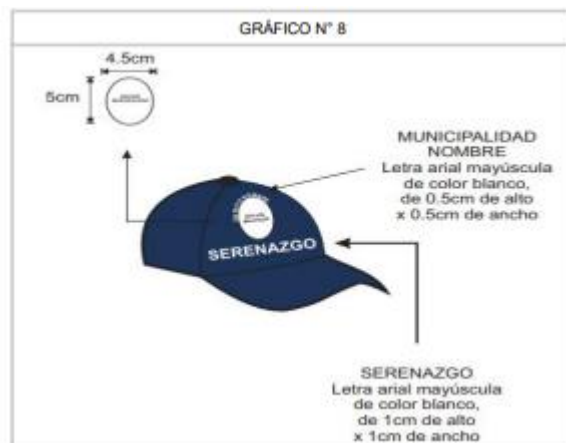
IMAGEN REFERENCIAL GORROS