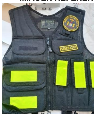
IMAGEN REFERENCIAL CHALECO TACTICO