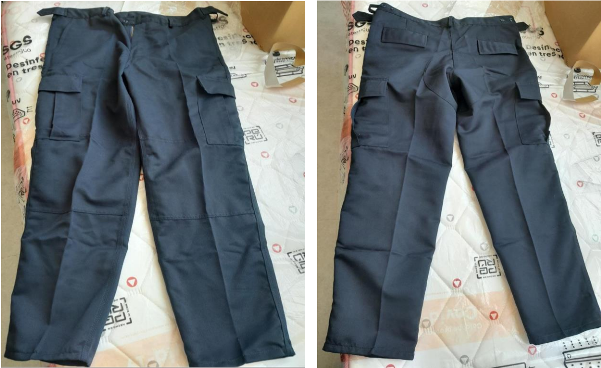
IMAGEN REFERENCIAL PANTALON PARCHIS

Botones 1 botón en el delantero del color de la tela, más un botón del color de la tela de repuesto cosido en el interior. Bolsillos 2 bolsillos laterales en la parte superior, dos laterales a la altura de la rodilla tipo comando con tapa y dos botones escondidos, dos bolsillos posteriores con tapa y dos botones escondidos