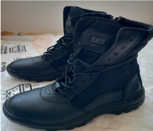
IMAGEN REFERENCIAL BORSEGUIS TACTICO