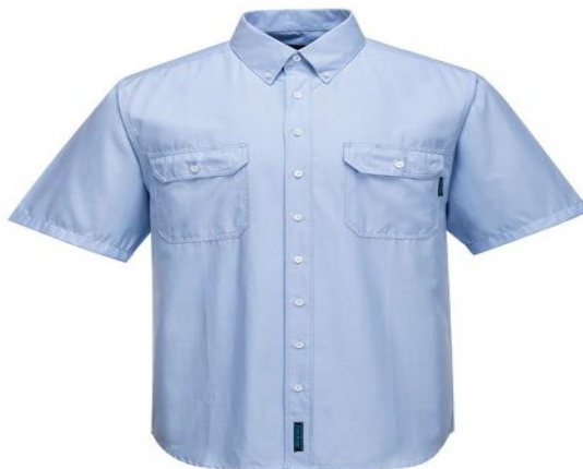
IMAGEN REFERENCIAL CAMISA MANGA CORTA