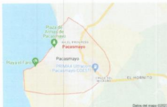
MICRO LOCALIZACIÓN DEL DISTRITO DE PACASMAYO