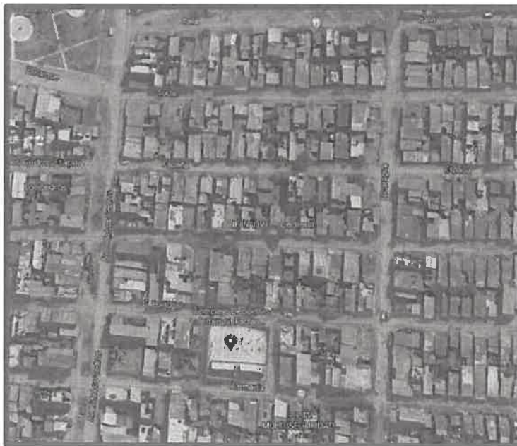
Figura N°1: Ubicación de la I.E. N°139.