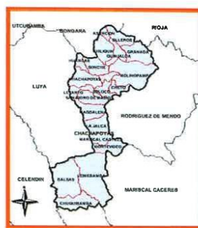
PROVINCIA DE CHACHAPOYAS