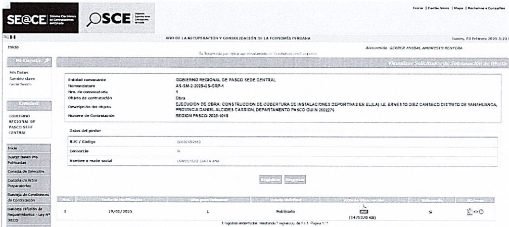
IMAGEN 2 extraída del SEACE

2025, se encontraba observada, por ello se requirió a través de CARTA N° 001-2025-AS-SM-02-2025-CS-GRP de fecha 29.01.2025 su corrección en un plazo de un (01) día hábil. El cual conforme a la imagen extraída del SEACE fue cumplida en el plazo otorgado: