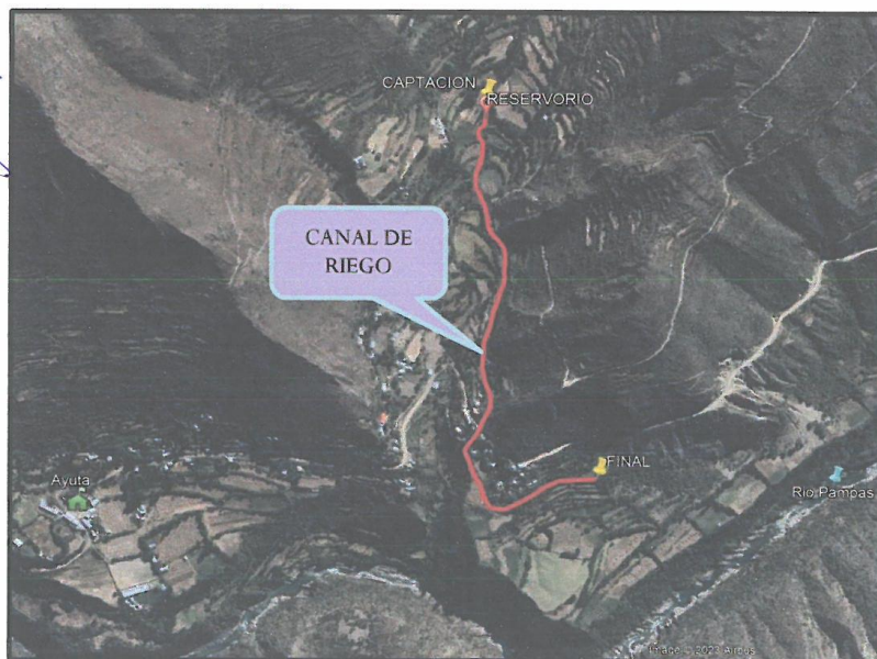
Figura 03: Imagen satelital de la ubicación del proyecto (canal de riego) – localidad de Ayuta

MUNICIPALIDAD DISTRITAL DE TOTOS PROYECTO CANAL DE RIEGO Ing. Federico López Todelano CIP N° 19614 PROYECTO DE INVERSIÓN DE INFRACONSTRUCCIÓN URBANA