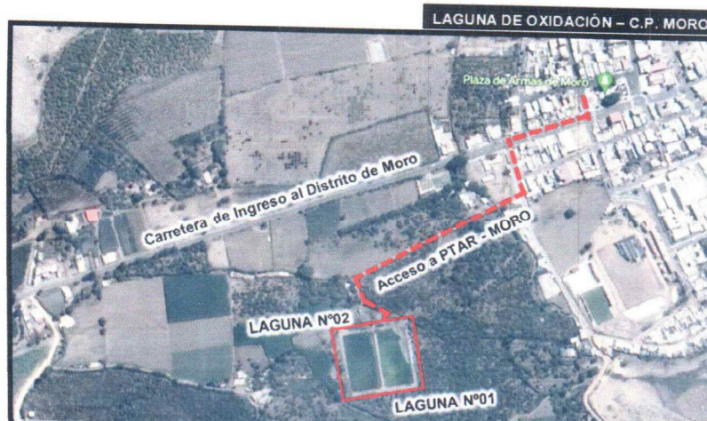
Vista del Área de Intervención del Proyecto

En la localidad de Moro, la PTAR se encuentra localizada a una altitud promedio de 465msnm entre las coordenadas entre 8988100 N – 8988250 N y 8090220 E – 80903400 E.