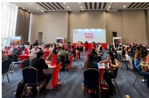
Imagen referencial sala rueda de negocios