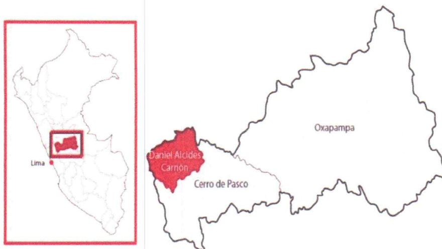
FIGURA N° 1 UBICACIÓN DEL PROYECTO