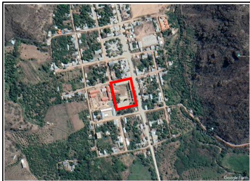
Ilustración 1- Ubicación del terreno

Región : La Libertad Provincia : Bolívar Distrito : Longotea Centro Poblado : San Vicente de Paul Dirección : Avenida Fernando Belaunde Terry