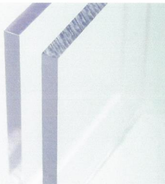
Imagen 2. Imagen Referencial de Policarbonato solido compacto.

Siliconas y Accesorios: Con pegado estructural emplea como elemento adherente entre el cristal y aluminio las siliconas estructurales componente y el mono componente. Para los sellos intemperie se emplea la silicona en acabado negro mate y gris. Adicionalmente el sistema utiliza el espaciador de doble contacto que es una espuma de poliuretano de células abiertas, la cual tiene la función de lograr un espesor uniforme de la silicona estructural a lo largo de su aplicación y permitiendo a su vez el ingreso de aire o humedad que facilita el curado de la silicona estructural. Los burletes empleados son diseñados para soportar los más extremos agentes externos como lluvias, rayos UV, oxígeno, etc. Se debe garantizar además su durabilidad y uniformidad en el tiempo.