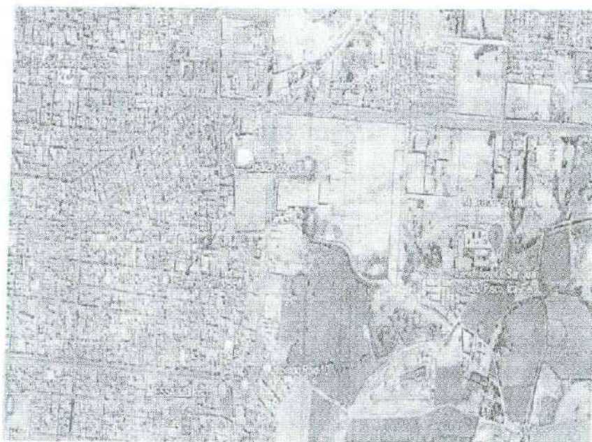
HOSPITAL SAN JUAN DE DIOS DE PISCO – ICA - PERU

"Año del Bicentenario, de la consolidación de nuestra independencia, y de la conmemoración de las heroicas batallas de Junín y Ayacucho"